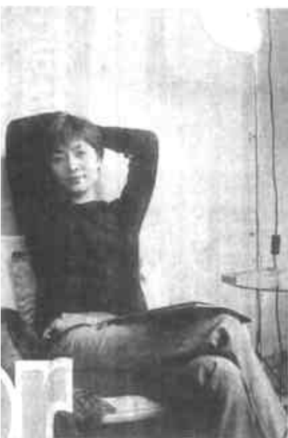
想有个梳妆台，是我从小女孩起就有的梦想。

清晨，和煦的阳光洒在小小的梳妆台上，睡眼惺忪的你沐浴在这片光辉中，扫去满脸的困倦，怀着自信昂扬的好心情，去享受生活中的每一天。夜晚，在柔和的灯光下，卸去一脸的疲惫，心境也变得温柔平静，安甜的进入梦乡。在梳妆台前的你是真实的，你尽可以对它呲牙咧嘴，挤眉弄眼，故作姿态，随意放纵你的面部表情，卸掉平日毫无生机的面具，做一回真正的自己。不用担心你的秘密被泄露，这是一个轻松的驿站，尽情享受那份难得的坦然与毫无畏惧吧！ 梳妆台上那瓶罐罐，都有一个令你难忘的回忆，它们就像亲密的老朋友，给你鼓励，给你信心，为你描绘一个色彩绚丽的人生大舞台。站在梳妆台前勾勾画画的女子是最动人的。千娇百媚，万种柔情，女性特有的温柔在这一刻得到淋漓尽致的体现。而她的那份专注、那份对美执着的追求，更让你觉得值得尊重。俗话说：“一个会照顾自己的人，才会照顾别人。”那么，一个懂得打扮自己的人，才能装扮自己的生活，给平淡的日子涂上亮丽的色彩，让自己的小日子过的有滋有味，感染着每一个生活在你周围的人。 梳妆台旁演绎着浪漫的故事。在镜子上用口红画一个火红的心，温暖爱人那颗为家庭承担责任而备感疲惫的心；和最爱的人在一起，让他用笨拙的手给你画一条粗大的眉，那份诚心诚意令你感动不已；从你背后给你带上一条心仪已久的项链，彼此对着镜子给予一个会心的微笑，感受心有灵犀的默契。浪漫的人编织浪漫的故事，要用情去创造，用心来体会。 在我的心中，一个爱梳妆台的女孩，对生活必定抱有积极进取的态度。她爱美，创造美，展示美，给这世界增添一道亮丽的风景。“爱美之心人皆有之”“窈窕淑女君子好逑”，试问天下人，又有哪一位不喜欢仪态万方而又赏心悦目呢！爱梳妆台吧，它不仅能展示你的美，还能为你酿造生活的蜜甜。“执子之手，与子偕老”，那么感人，美好的誓言，在每一个其乐融融的日子里，就让梳妆台印证我们虽已渐渐衰老的容颜却依然不改的两颗年轻、真挚的心。我快结婚了，婆婆给我买了价格不菲的家具，但我唯独没让她买梳妆台。它是我心中的一块绿洲，我将把这个小小的梦留给自己。