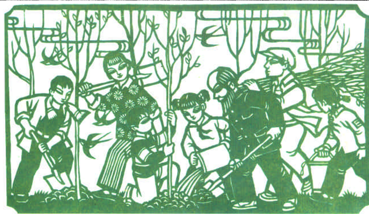
植树造林 人人有责