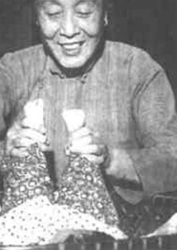
一下流了出来，一是感动：两位继母竟如此及时地出现在我的眼前。二是害怕：担心自己再也起不来了。她们见状就你一言我一语地安慰我，让我别急、别怕，不会有事的。真的，经过她们的推拿、针灸、拔火罐，几天下来，我的脖子又运转自如了。 俗话说：两好和一好。对我们做晚辈的也好应用对自己亲生父母的心去对待，比如，我婆婆继母来了亲戚，我热情招待；娘家继母有病，我热情陪护；娘家继母到外地诊疗；每逢节日和她们的生日，都送上一份贴心的礼物等。有时间、有空闲时还要常回家看看。 人之初，性本善。只要我们有一颗善良的心、宽容的心，一颗爱心，何愁没有“人心换人心、四两换半斤”呢？我的两个继母都有自己的儿女，她们都是合格的母亲，对她们自己的亲生儿女是，对我们也是！

人世间最伟大的爱是母爱，而这里的“母”一般指生母。以前，说书唱戏的总是把后母描述成蛇蝎心肠，但我要说后母也是母这是我的两个继母给予我的结论。 我的继母去世十多年了，现任继母进门近十年，刚来时我才二十多岁，常常想着要做什么买卖，以挣钱减轻儿女们和我公公的负担；平时家中做点好吃的，就专程叫我们回去吃。她还有“扎针、拔火罐”的手艺，正好我的颈椎、腰椎不好，也就常有受益。接触多了我们都相互觉得对方很真诚、很善良，也很投机，也就经常聊聊天。特别是婆婆怎样去的东北，什么事在东北怎样办，在她的老家如何兴，她的哪位亲人怎样怎样，还有一些传说等等，真可谓无话不说。以至我原来婆婆的弟弟来看我们时感慨地说：“我看看你们俩比原来的亲娘俩还好！” 我母亲去世也已四年，七十岁的父亲也组织了新的家庭。继母尽管只到我们家三年的时间，却也让我们深切地感受到了她博大的母爱。我姐在偏远的农村，时间一长不回来，继母会打电话问回是否有啥事、身体好不好、怎么不来往娘家？弟弟的孩子小，有时因工作忙无暇照顾，她就骑上三轮车到托儿所接送、帮助照看；我哥的女儿上大学了，她一下送上一千元资助…… 有一次，我的颈椎病复发，午休后竟痛得起不来了，经过许多努力无效后想起了两个继母，便在床上打电话向她们求援。当时只有娘家继母接到了电话，匆匆往我家赶，路上正好碰上我婆婆，两个继母一起来我家。见到她们我的眼泪